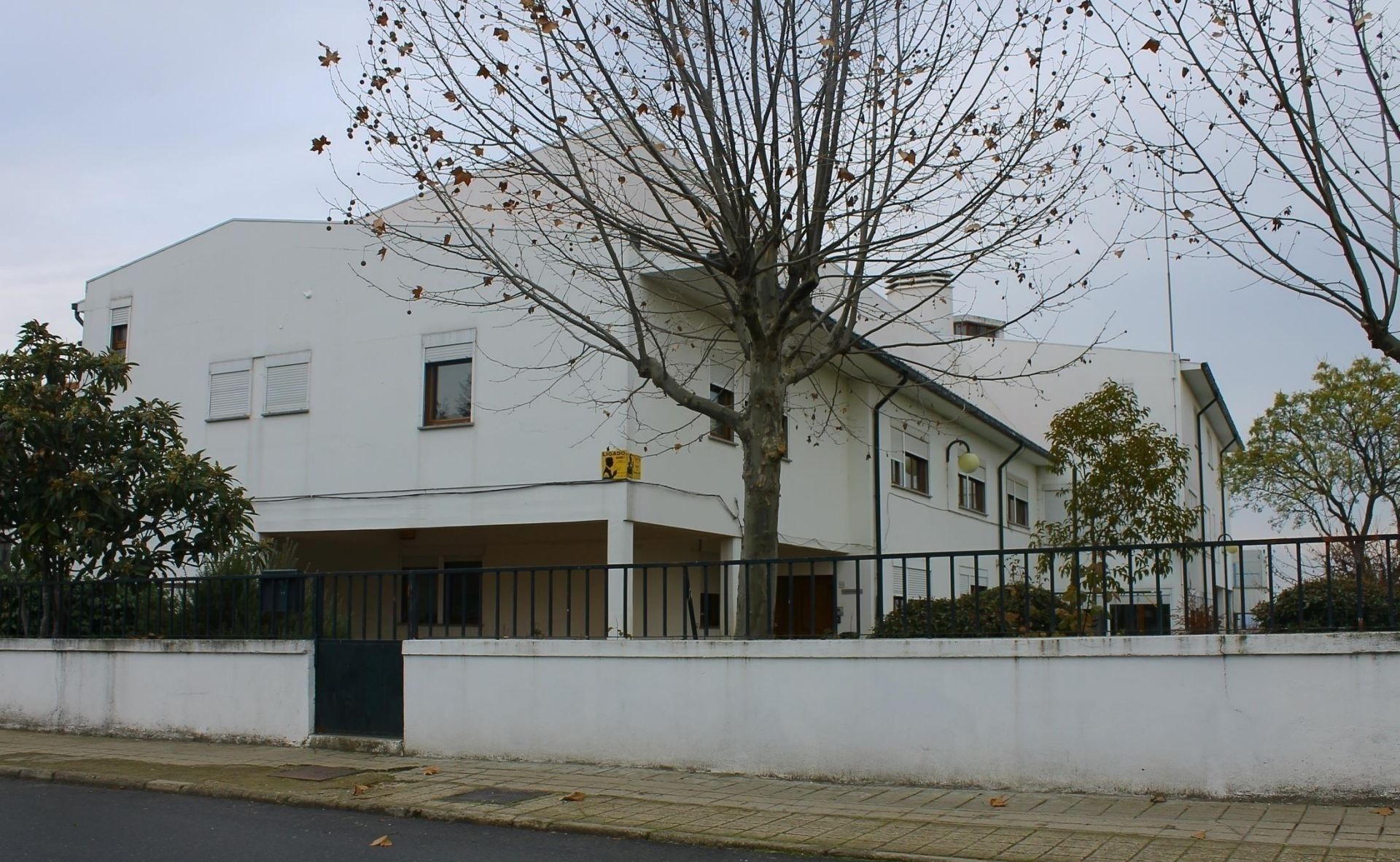
Lar de S. Francisco: Rua 1.º de Maio Lar de Infância e Juventude – Casa de Acolhimento