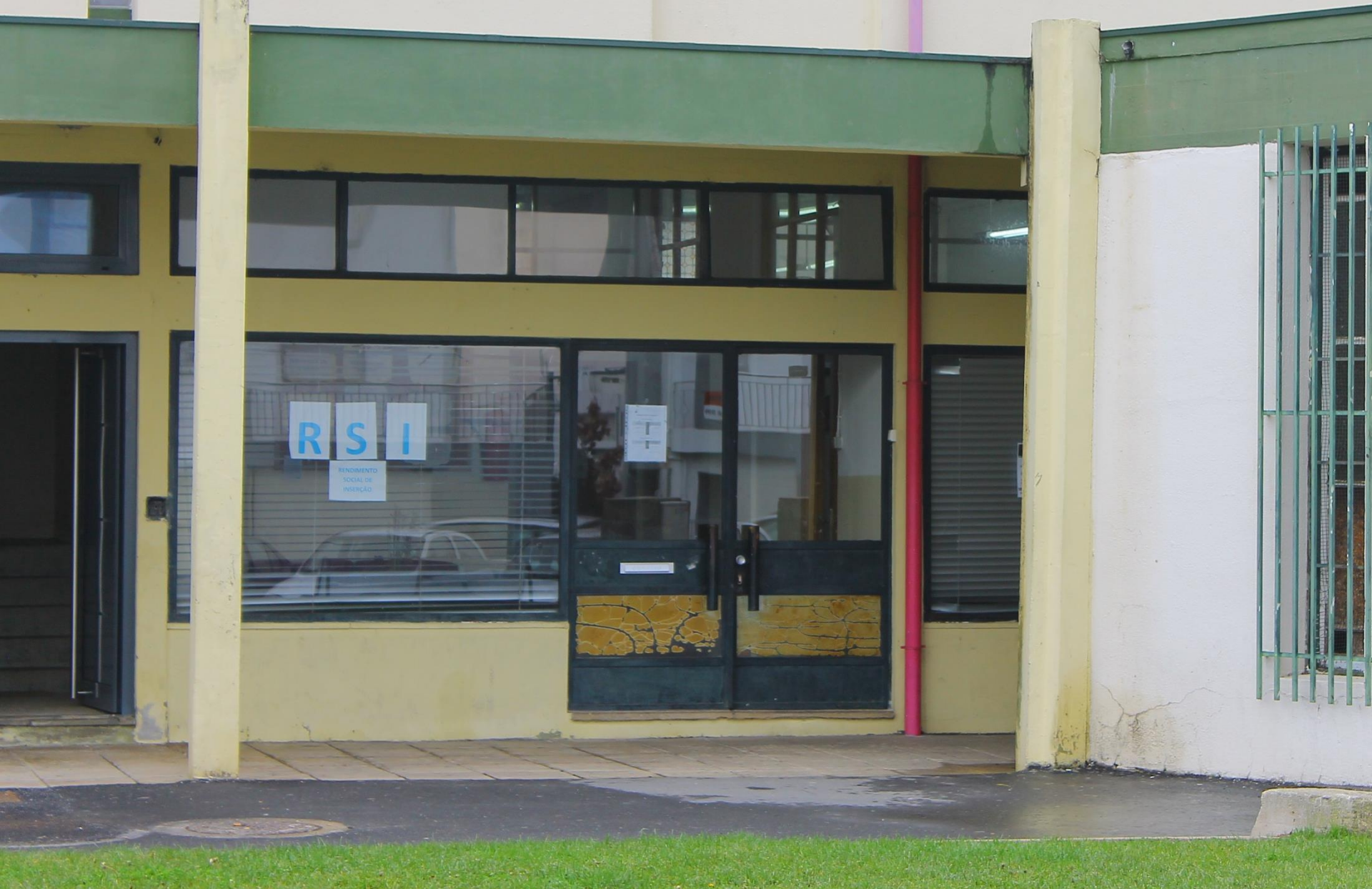
RSI - Rendimento Social de Inserção Bairro Fundo Fomento Habitação – Mãe d'Água